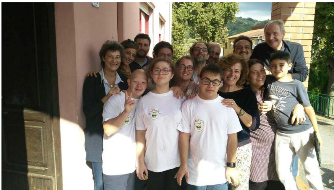
I membri del Forum presso la Comunità progetto Sud, associata al Forum