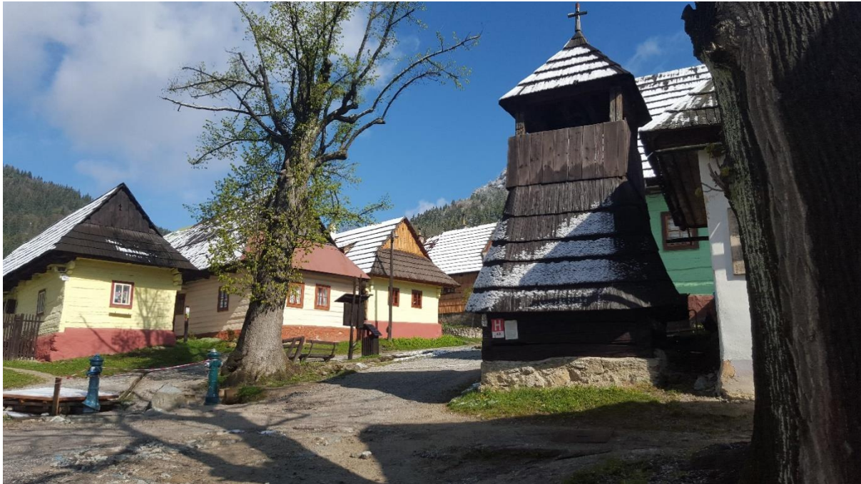
View on wooden houses in Vlkolínec, on the right is a historic bell tower built in 1770.