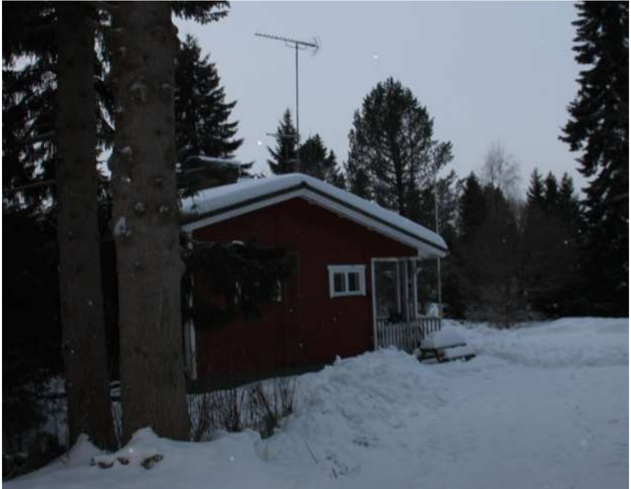
Noidanlukko house "Information center Hanhikivi"

Noindalukon ylläpitämä "Tiedotuskeskus Hanhikivi.